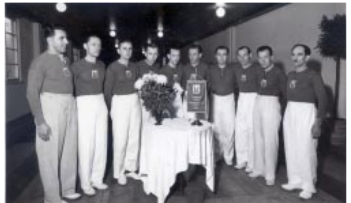
Obrázek cca z roku 1949 - nástup hráčů. Nezbytností byly dlouhé světlé kalhoty.