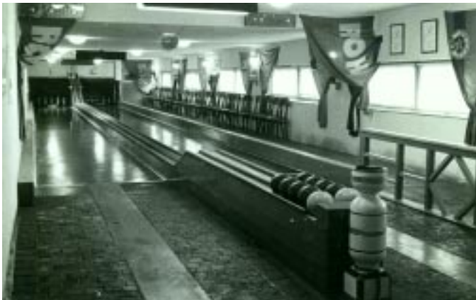
Vlevo obrázek běžné dvoudráhové kuželny - povrch asfaltový, rozběžiště - bukové kostky zalité asfaltem (1954).

Od roku 1953 do roku 1991 bylo postupně vydáno několik metodických příruček, které se zabývaly všemi povinnostmi trenéra, od rozcvičky přes speciální trénink, regeneraci a rehabilitaci až po právní odpovědnost trenéra. Vzestup výkonnosti našeho sportu je zcela jistě spojen i s jejich existencí.