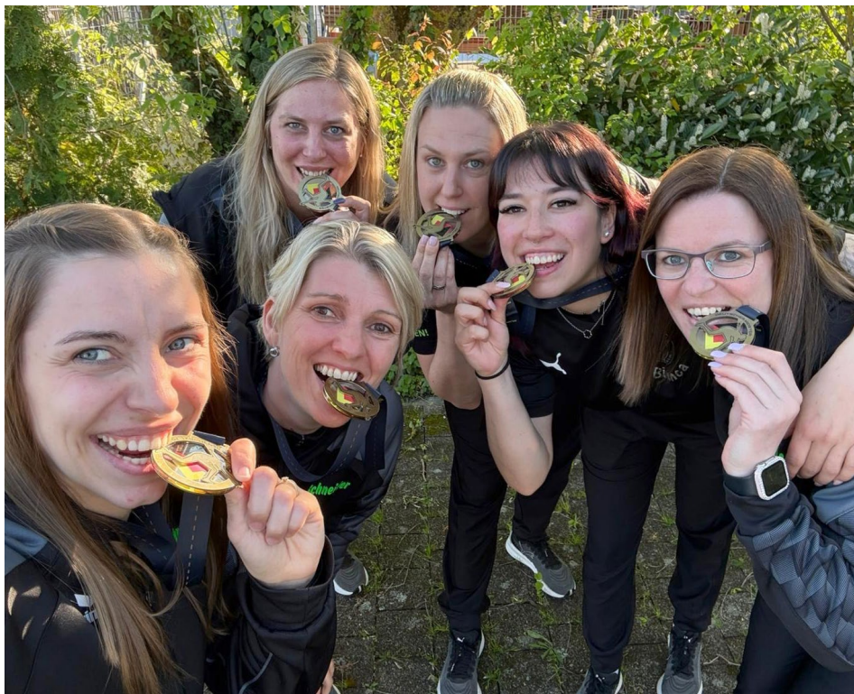
Liedolsheim obhájil titul díky poslednímu utkání