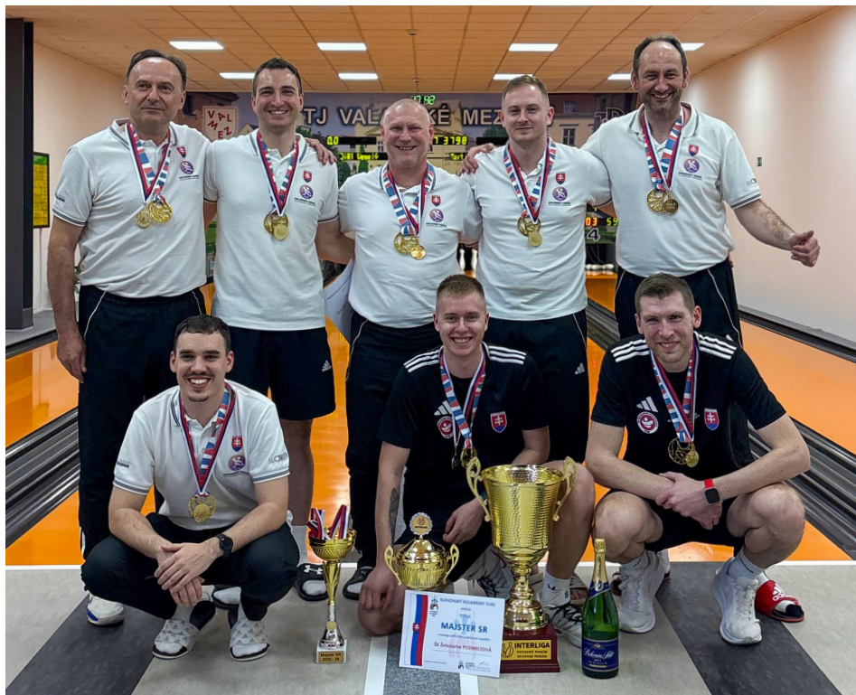
Letošní souboj o titul byl otevřený až do konce