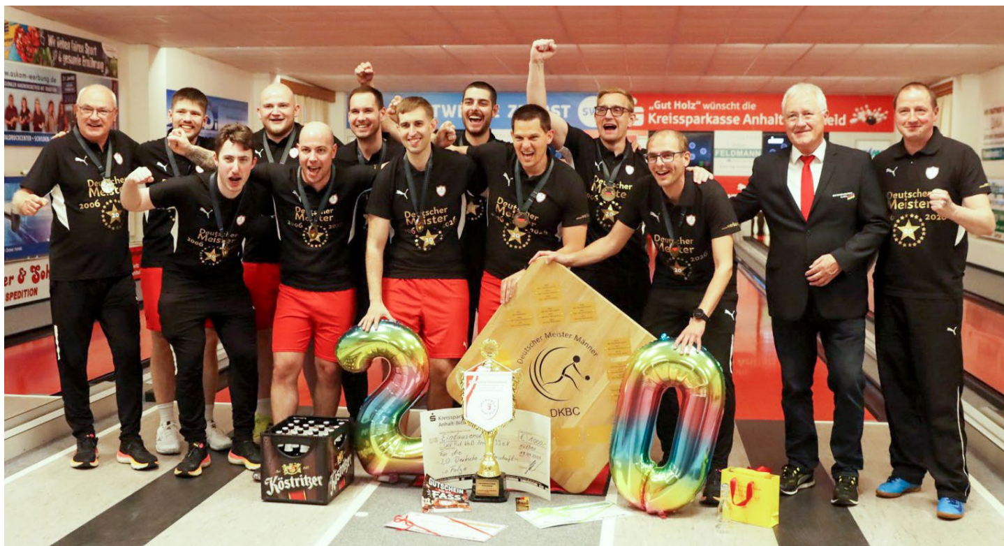
Zerbst letos neprožil ideální sezónu, přijdou velké změny

KV Liedolsheim a SV Pöhlwitz měly po podzimu shodně šestnáct bodů. Na jaře se Liedolsheimu „podařilo“ prohrát na půdě Bautzenu. Ve stejném kole ztratil i Pöhlwitz remízou v Bambergu. Přesto měl