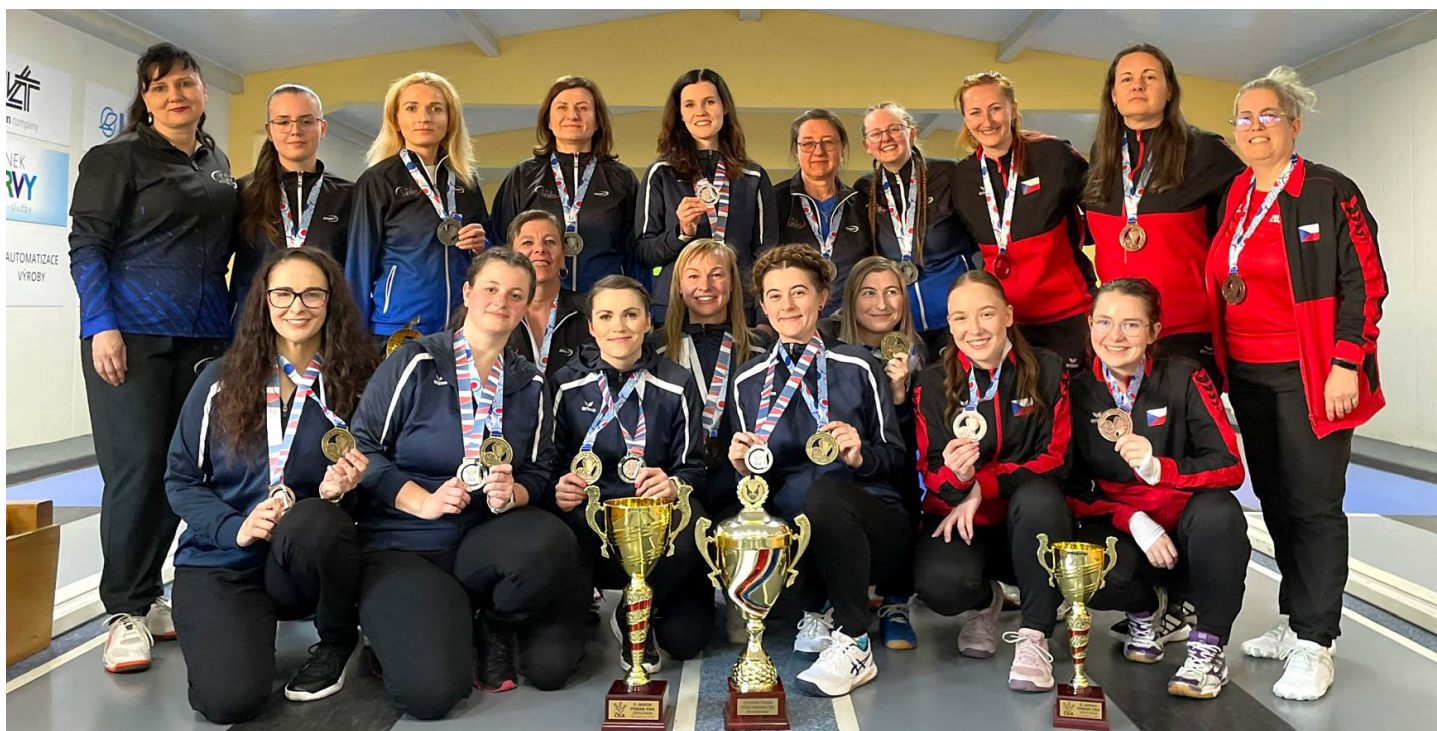
Dačická kuželna přinesla mnoho vynikajících výkonů, včetně nového českého rekordu na 4×120 hs