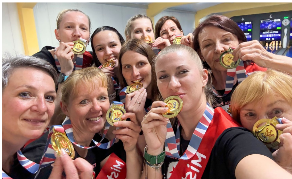
Slávistická pozlacená sezóna 2025–2026

Pojďme se ale ještě podívat na rozluštění druhé tajenky. Rosice 28, Jihlava 27.