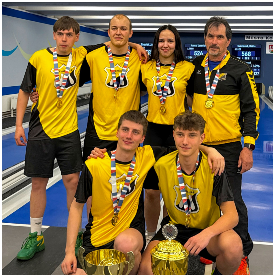
Lomnice na finálovém turnaji dominovala