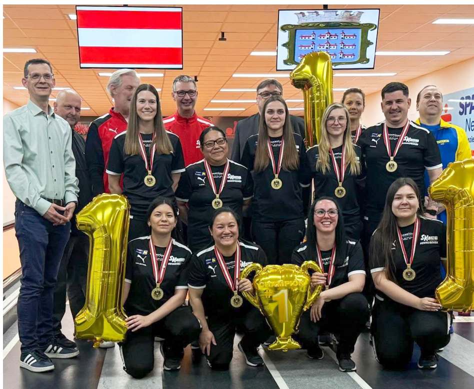
Ženský výběr Neunkirchenu obhájil rakouský titul