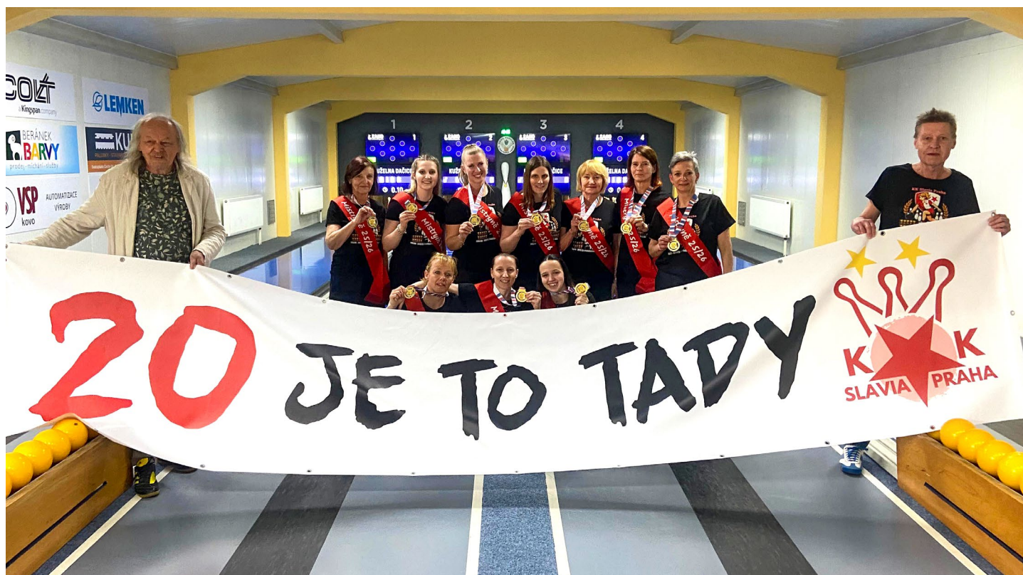
Slavia v Dačicích oslavila jubilejní dvacátý titul v české lize