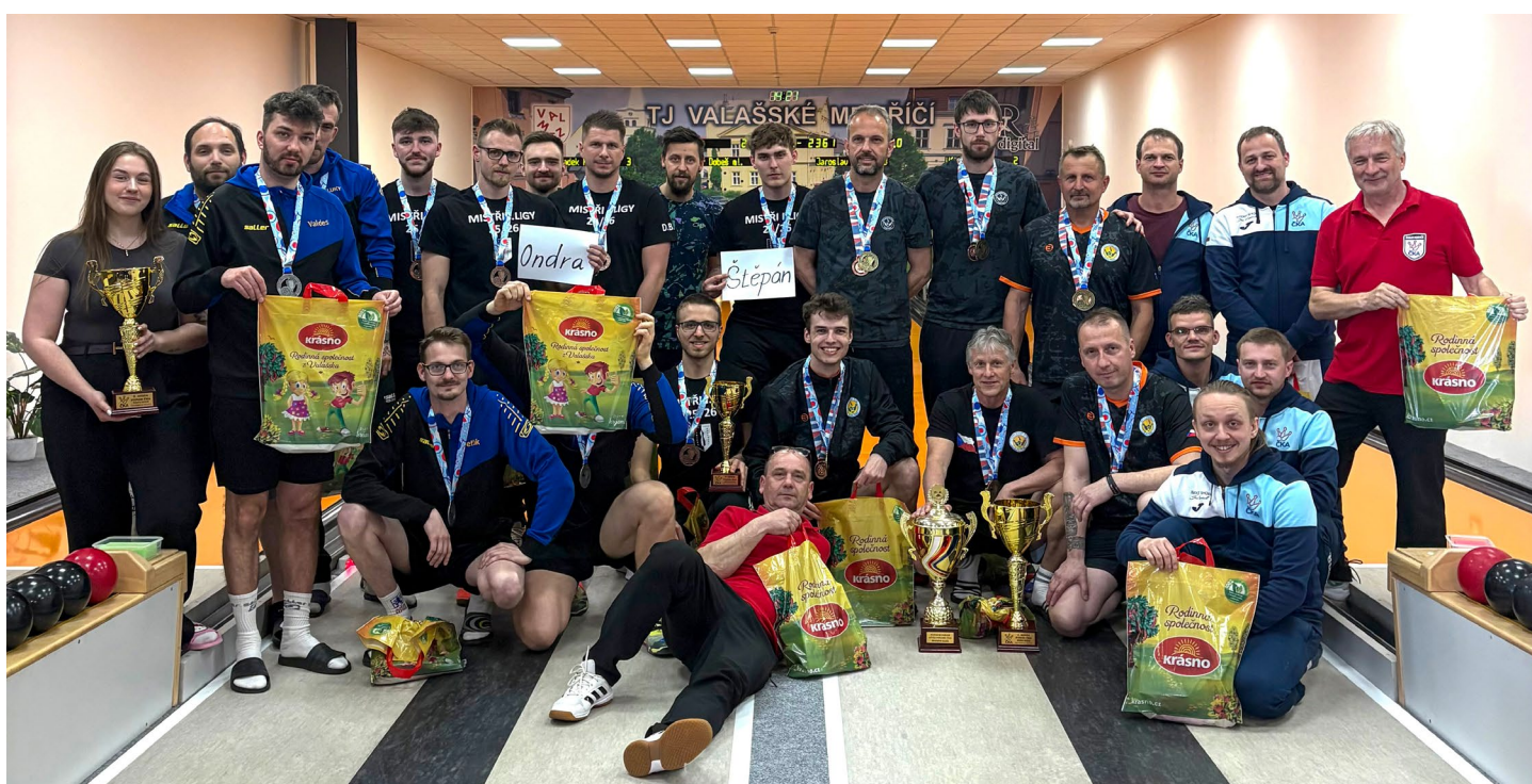
Turnaj Final Four ve Valašském Meziříčí byl soubojem interligových a prvoligových týmů