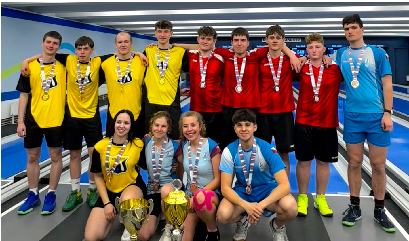
Finálový turnaj hostila šestidráha ve středočeských Kosmonosích