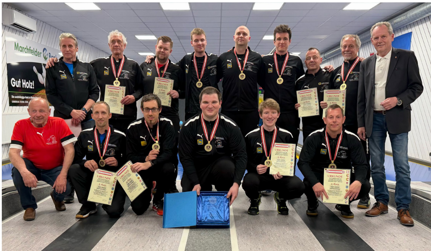
I přes dvě venkovní prohry Orth slaví třetí rakouský titul v řadě