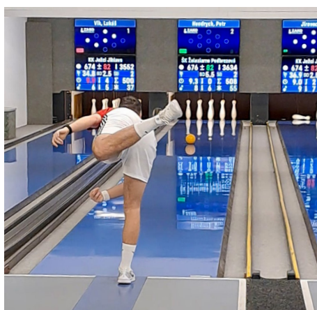
Momentka z bitvy Jihlava vs. Podbrezová