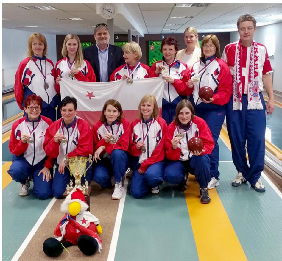
Dnes již archivní fotka z titulu Slavie z roku 2015