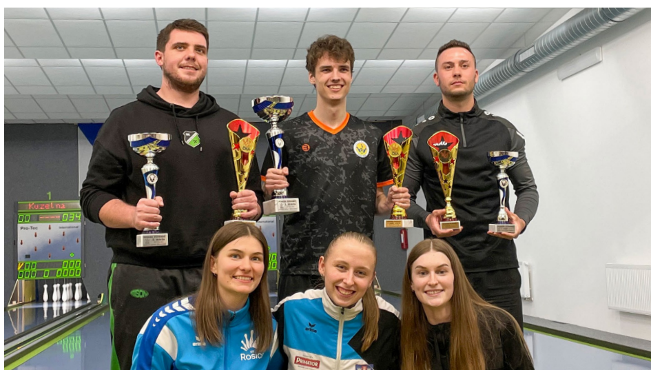
Úspěšní junioři z 9. ročníku Poháru juniorů s vítězi uprostřed