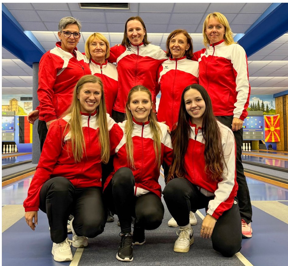
Jedenáct dlouhých let od posledního zlata se Slavia Praha raduje z titulu

Přesto jarní los jistotu titulu zdaleka nedával. Po remíze s Náchodem B a prohře