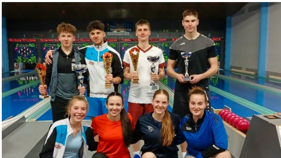
Medailisté z 13. ročníku ČPD