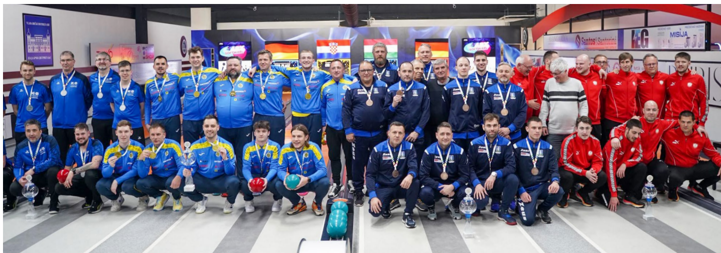
Společné foto účastníků turnaje Final Four Ligy mistrů v Brčku