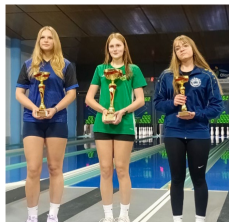
Foto vítězů jednotlivých kategorií PMN