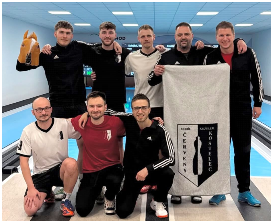
Červený Kostelec si vybojoval postup do Interligy

Stoprocentní jarní bilanci na domácí kuželně drží i Sadská, ale tři porážky na