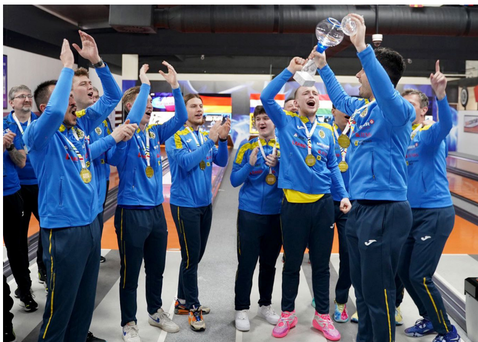
KK Zaprešić ovládl letošní ročník Ligy mistrů