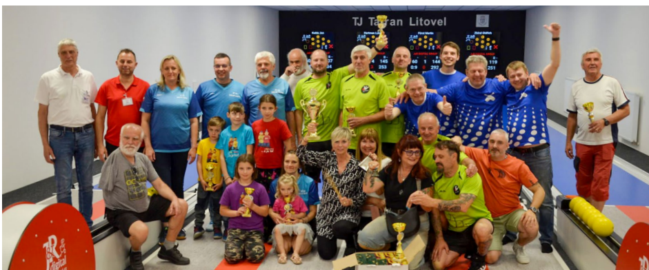
V loňském roce hostila finále MČRN kuželna v Litovli