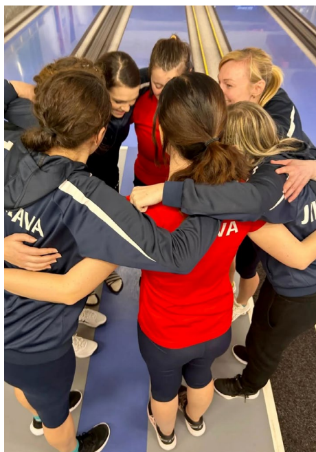
Jihlava je na jaře zatím stoprocentní

Kdo získá titul? 20, 19, 19 jsou aktuální bodové zisky Slavia, Jihlavy a Rosic. Slavia si drží mírný náskok a navíc má utkání ve Valašském Meziříčí v zatím blíže neurčeném termínu k dobru. Právě Valašky mohou v souboji o titul hrát jednu ze zásadních rolí. V tabulce jsou čtvrté, mohou hrát bez tlaku a navíc všechny tři top celky mají doma. Valmez je doma silný, takže může favority nacytat. Speciálně Jihlava