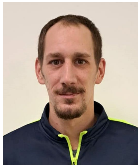
Skokan roku je kmenový hráč Bílovce

Pocity mám skvělé. V životě by mne nenapadlo, že něco takového mohu vyhrát. Jsem strašně rád, že mám tolik lidí kolem sebe, kteří mne podporují a fandí mi. Vážím si toho!