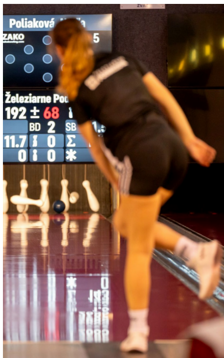
Podbrezová podlehla Bambergu...