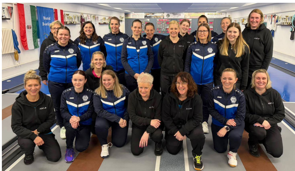
Tatabánya zdolala BBSV Wien a zahraje si poprvé Final Four Ligy mistrů