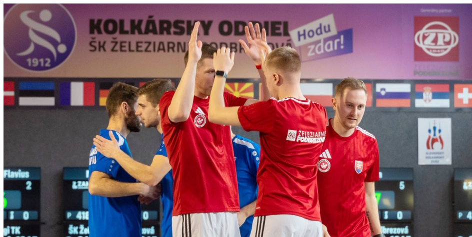
Ani mužský tým železáren se letos do Final Four Ligy mistrů nepodívá

Trstená v prvním kole čtvrtfinále zavítala na kuželnu do Raindorfu a už od začátku bylo jasné, že Slováky čeká nelehký souboj. Raindorf letos vyhrál Evropský pohár, na kterém Trstená skončila na smolném čtvrtém místě. Přestože nejlepším hráčem utkání byla interligová hvězda Congor Baranj (677), Trstené se zvítězit nepodařilo (2:6, 3658:3810). V odvetě měli Slováci výhodu domácí půdy, na Němce ale i tak nestačili. Tentokrát se stal nejlepším hráčem zápasu