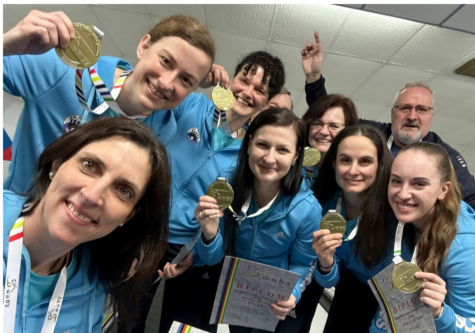
Hlasující určili Událostí roku 2025 výhru Rosic v Lize Mistrů