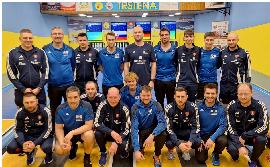
Raindorf díky postupu přes Trstenou může pomýšlet na obhajobu titulu