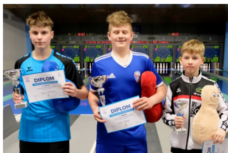
Starší žáci – vlevo medailisté celkového pořadí, vpravo medailisté finále