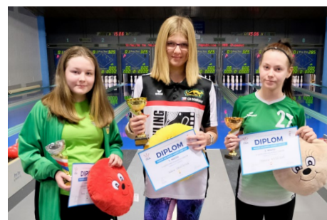
Mladší žákyň – vlevo medailistky celkového pořadí, vpravo medailistky finále