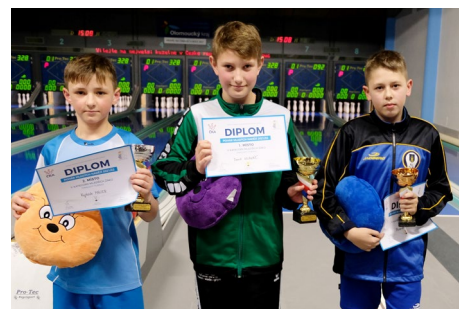
Mladší žáci – vlevo medailisté celkového pořadí, vpravo medailisté finále