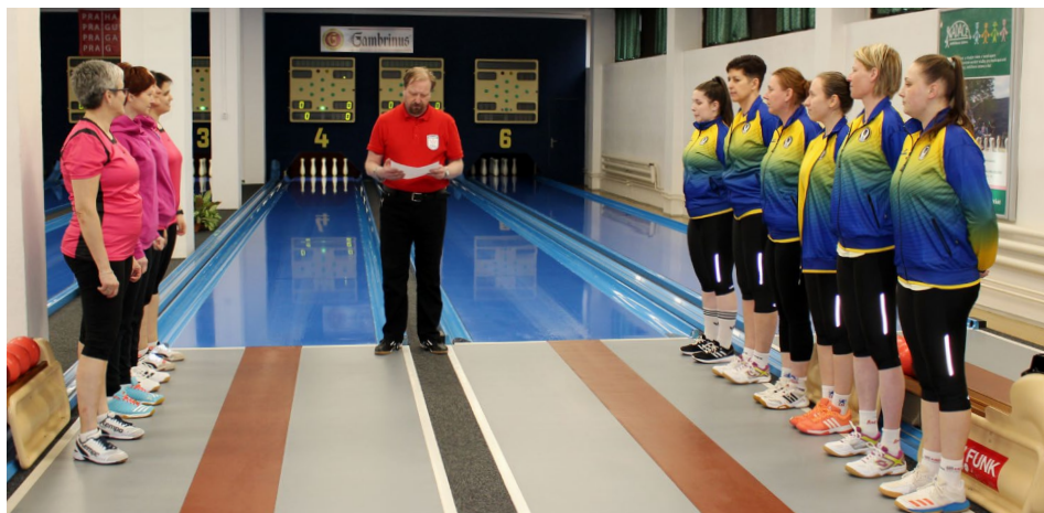
Ze zápasu Konstruktiva Praha vs. Zlín

První polovinu tabulky uzavírá Přerov, který vyhrál naposledy v 7. kole a od té doby přišly už jen čtyři prohry, jedna remíza a odložené zápasy. Na jaře prohrál Přerov doma s Rosicemi a s Jihlavou a venku na Konstruktivě. Cenný bod však přivezly Přerovanky z Rokycan. Celé družstvo ale předvádí slabší výkony, než na jaké jsme u těchto zkušených hráček zvyklí.