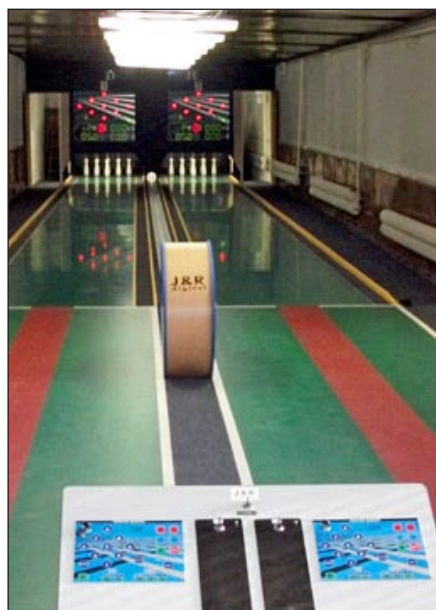
Kuželna SK Sigma MŽ Olomouc