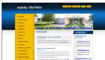
TJ Lokomotiva Trutnov http://kuzelky-trutnov.webnode.cz