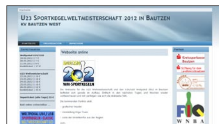
SP U14/U18 a MS U23 v Bautzen http://www.u23wm.de