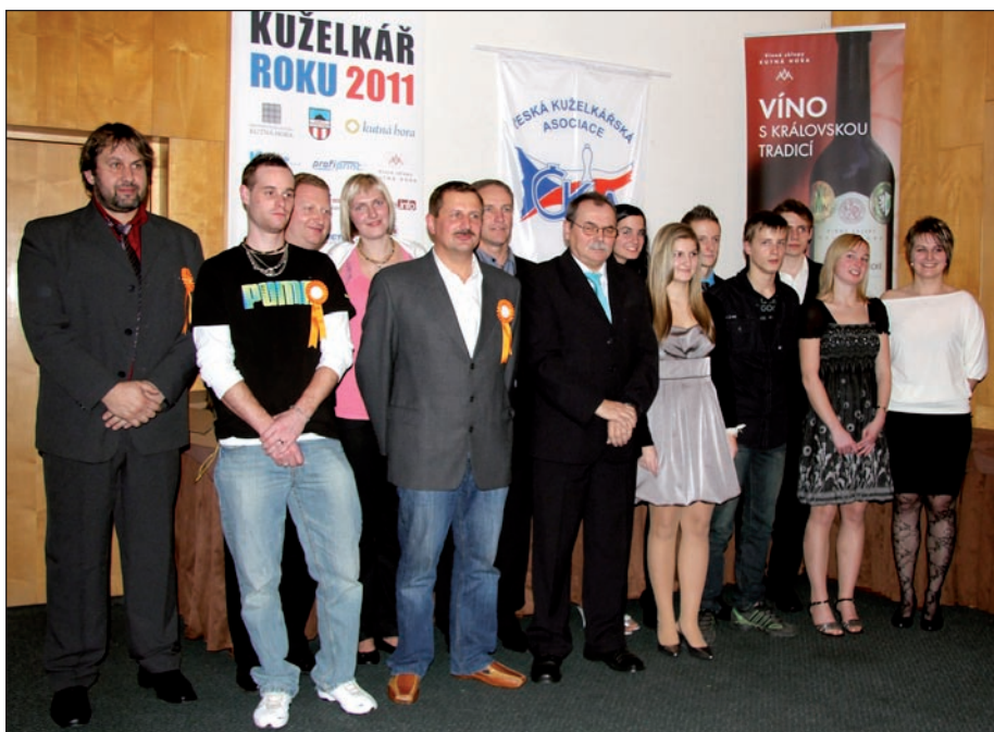
Společná fotografie oceněných kuželkářů a kuželkářek za rok 2011