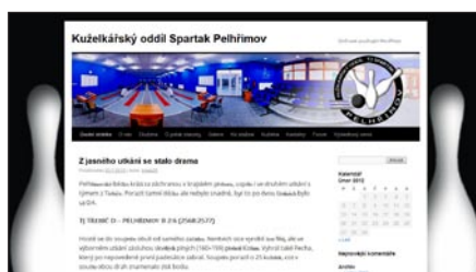
TJ Spartak Pelhřimov http://www.kuzelkype.cz