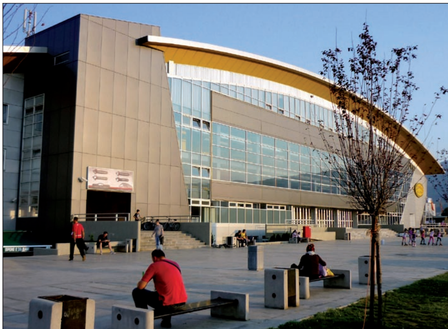
Hala v makedonské Skopji, ve které se uskutečnil letošní ročník Poháru NBC