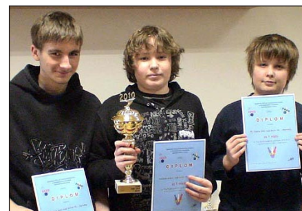
Vítězné družstvo 2. ročníku poháru