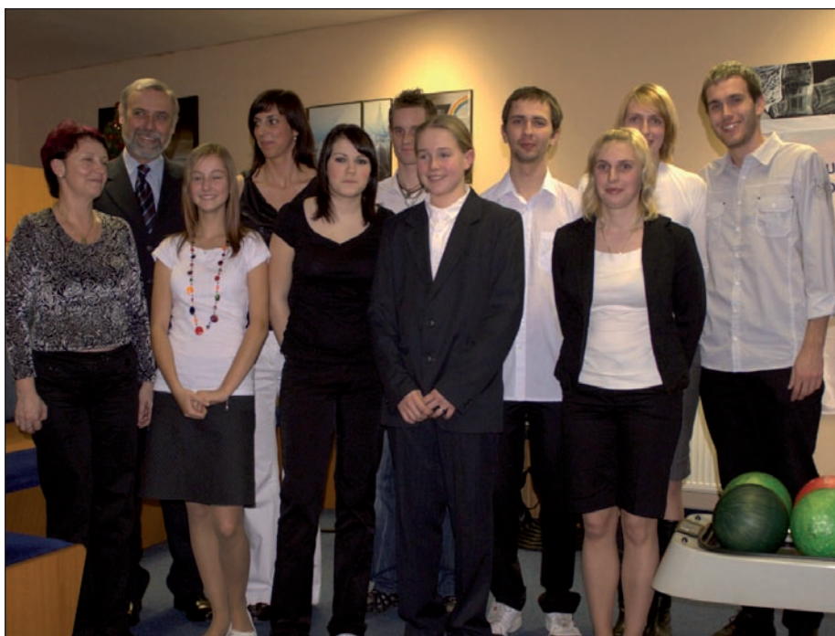
Ocenění kuželkáři za rok 2008, kteří byli přítomni na slavnostním večeru