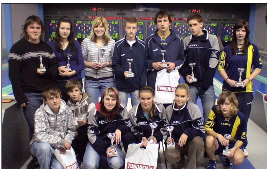
Hráči a hráčky medailových družstev – Zlínského, Ústeckého a Pardubického kraje