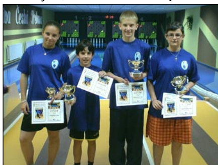
Nahoře družstvo Karlovarského kraje Dole družstvo kraje Vysočina