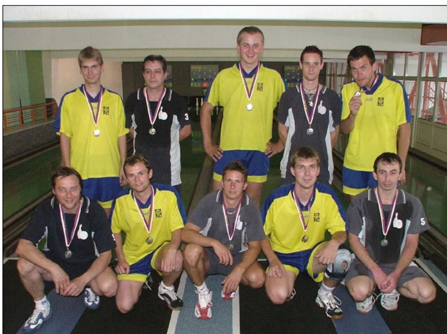
Loňští finalisté P-ČKA – KK PSJ Jihlava a TJ Lokomotiva Česká Třebová

jeden ze zakládajících členů a dlouholetý předseda KK Zábřeh. Odešel jeden z nejobětavějších členů naší asociace. Pro kuželky žil desítky let a v klubu si vychoval řadu zdatných nástupců. Čest jeho památce.