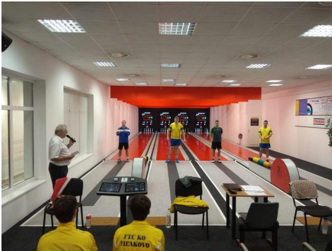
Filakovo při snaze získat první body v Hořicích.

Hořice mají těžkou pozici. Prvním důvodem je nováčkovství v soutěži, kdy se musí vyrovnat s novými kuželkami a těžkými soupeři. Druhým důvodem je jejich nově zrekonstruovaná kuželna, se kterou neměly tolik času se sžít a detailně ji poznat, což je připravilo o výhodu domácích drah. Nejenže tak Hořice svádí těžké boje venku, ale velmi těžké je pro ně získat body i doma. To bylo patrné i v utkání proti poslednímu týmu tabulky a druhému z nováčků v soutěži Filakovu. Hořice musely doufat až do posledních hodů, že se štěstí přikloní na jejich stranu. Filakovo tak přišlo asi o svoji největší dosavadní šanci získat první body a jako jediný tým stále zůstává bez bodu.