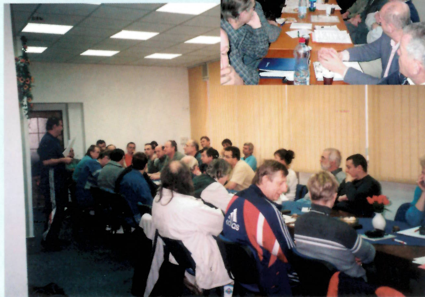
Školení trenérů II. třídy