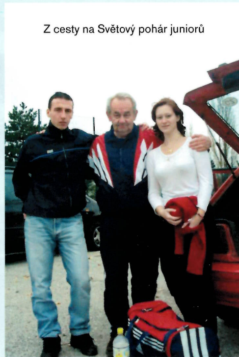
Z cesty na Světový pohár juniorů