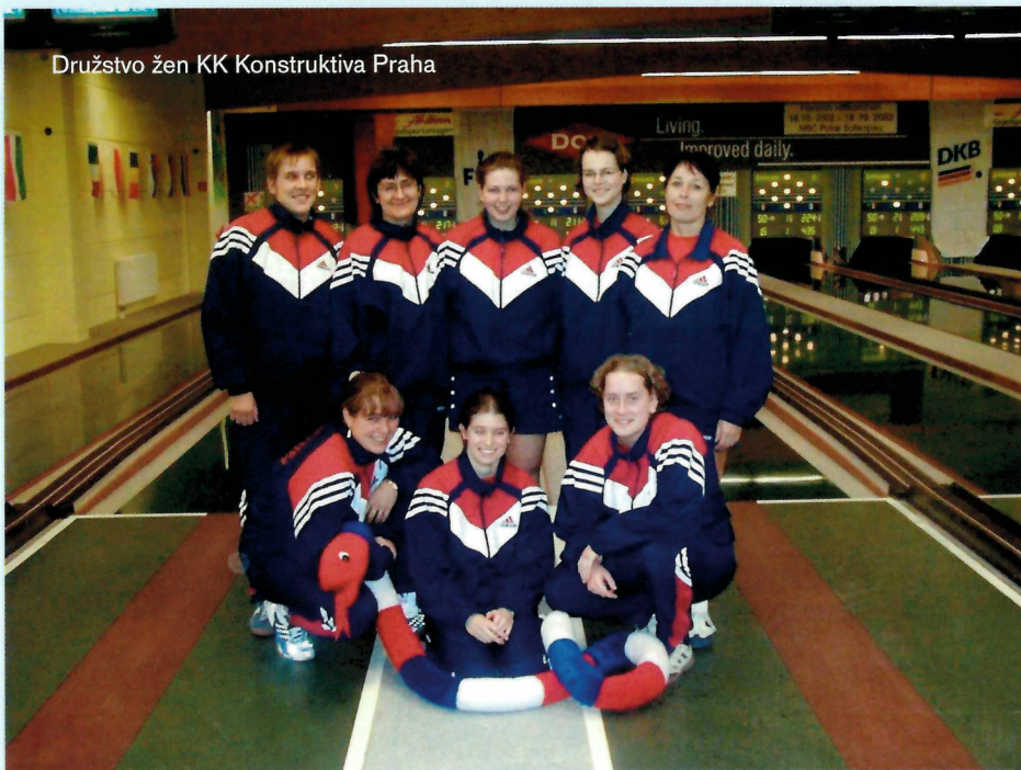
Družstvo žen KK Konstruktiva Praha