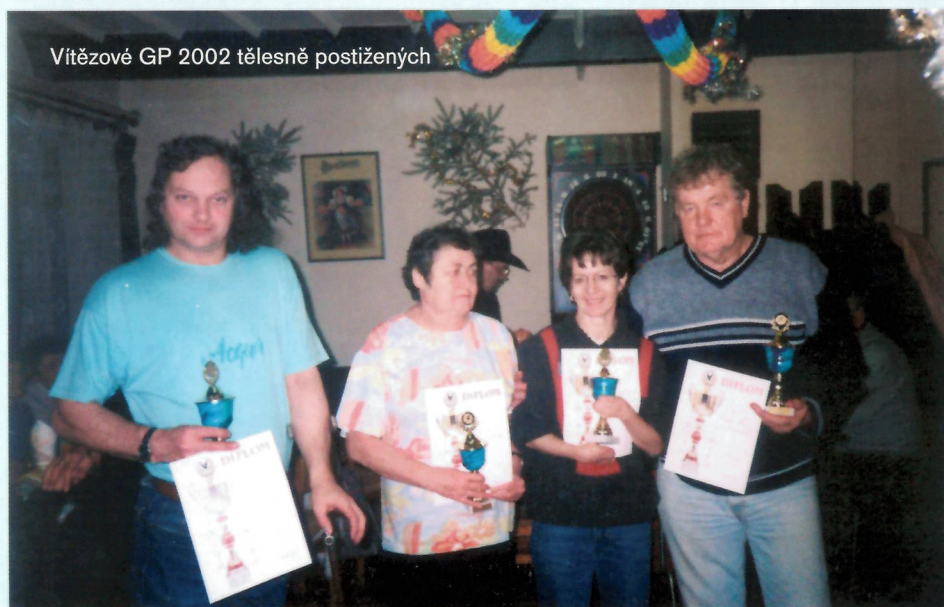
Vítězové GP 2002 tělesně postižených