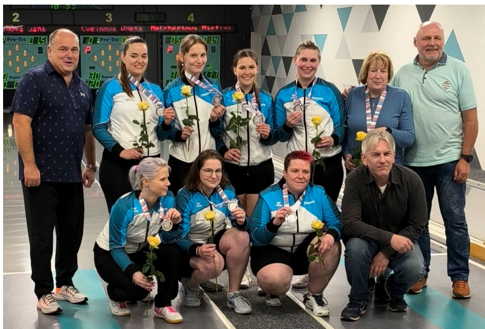
Stříbrné medaile si vybojoval SKK Primátor Náchod A