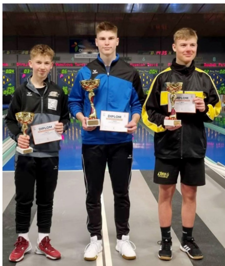
Držitelé cenných kovů z letošního ročníku ČPD