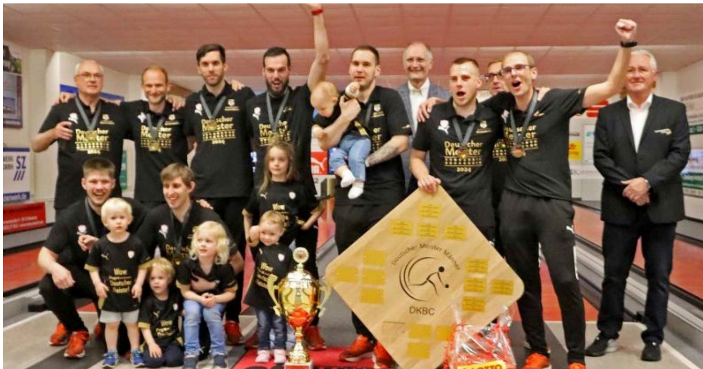
Ani po osmnácté v řadě se oslava titulu neomrzí, vítězná radost Zerbstu

Na druhém místě se umístil potřetí za sebou SKK Raindorf se ztrátou pěti bodů, i zásluhou jediných dvou českých hráčů v soutěži. Třetí skončil Bamberg, který si polepšil z loňského šestého místa, bram-borová medaile zbyla na loni třetí Hallbergmoos. Ze tří nováčků se v první Bundeslize zachránil pouze Markranstädt. Mörfelden a Planktstadt se po roce opět vrací do druhých lig, ten druhý dokonce bez jediné výhry v sezoně, sestupovou trojku doplnil Wernburg.