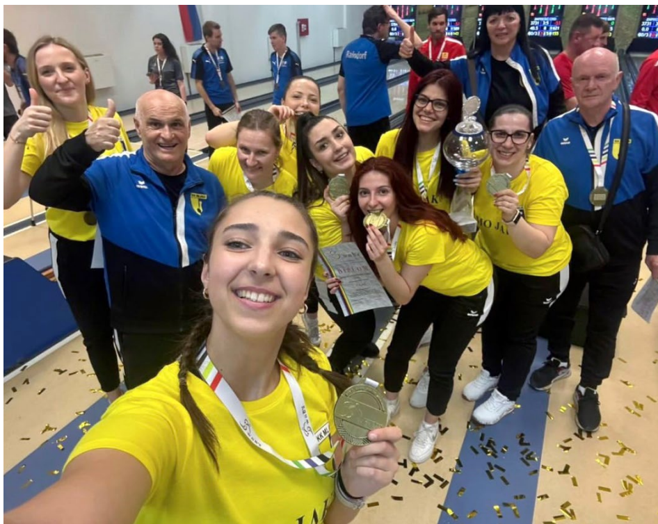
Vítězné selfie hráček Mlaky Rijeka

putoval do Česka. „Letošní úspěch z Ligy mistrů nás těší a jsme za něj moc rády, i když jsme možná vzhlížely trošičku výš. Opět jsme ale nasbíraly spoustu cenných zkušeností do dalších let,“ komentují úspěch Rosičky.