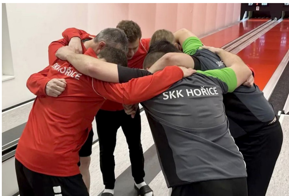
Hořice se po roce vrací do Interligy