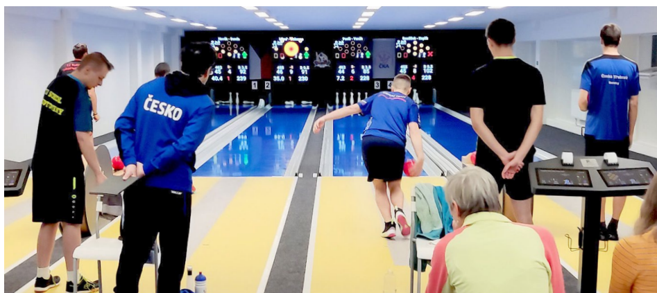
Kontrolní start dorostenecké reprezentace hostila kuželna v Radotíně

poté pokračovat v neděli sprinty a tandemy na kuželně v Přerově. V obráceném sledu absolvují třídní sraz elitní výběry. Již od pátku budou hráči a hráčky bojovat o účast na světovém šampionátu na nelehké kuželně v Otrokovicích a následně se v neděli