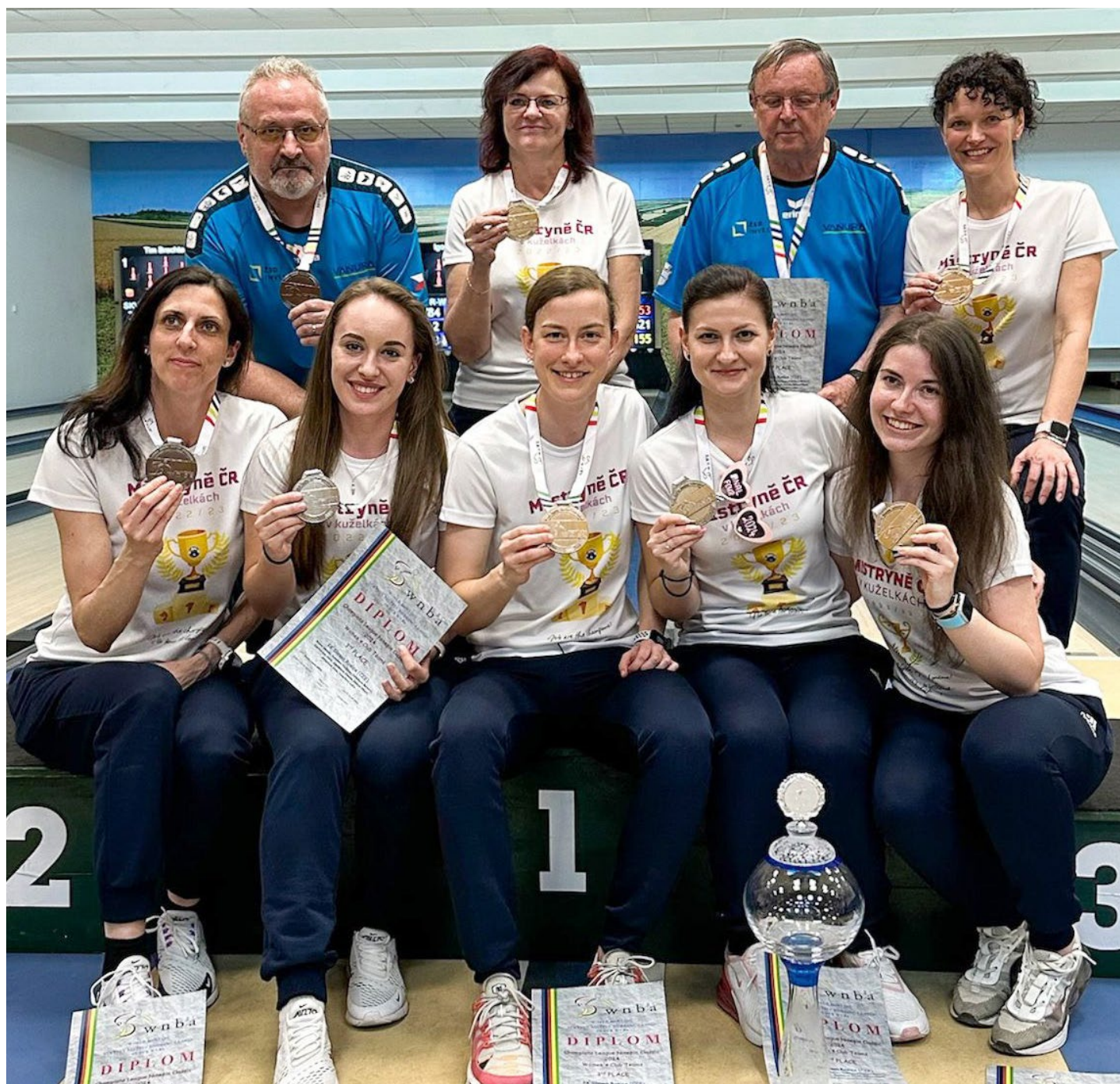
Bronzová sestava Rosic spolu s trenéry