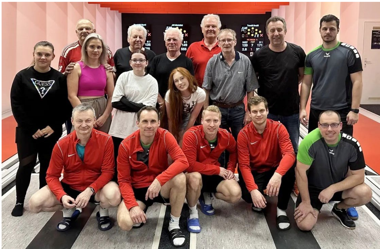
Vítězný tým Hořic netvoří jen hráči, ale rovněž i věrní fanoušci