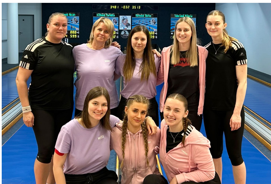
Bronz putuje do Valašského Meziříčí