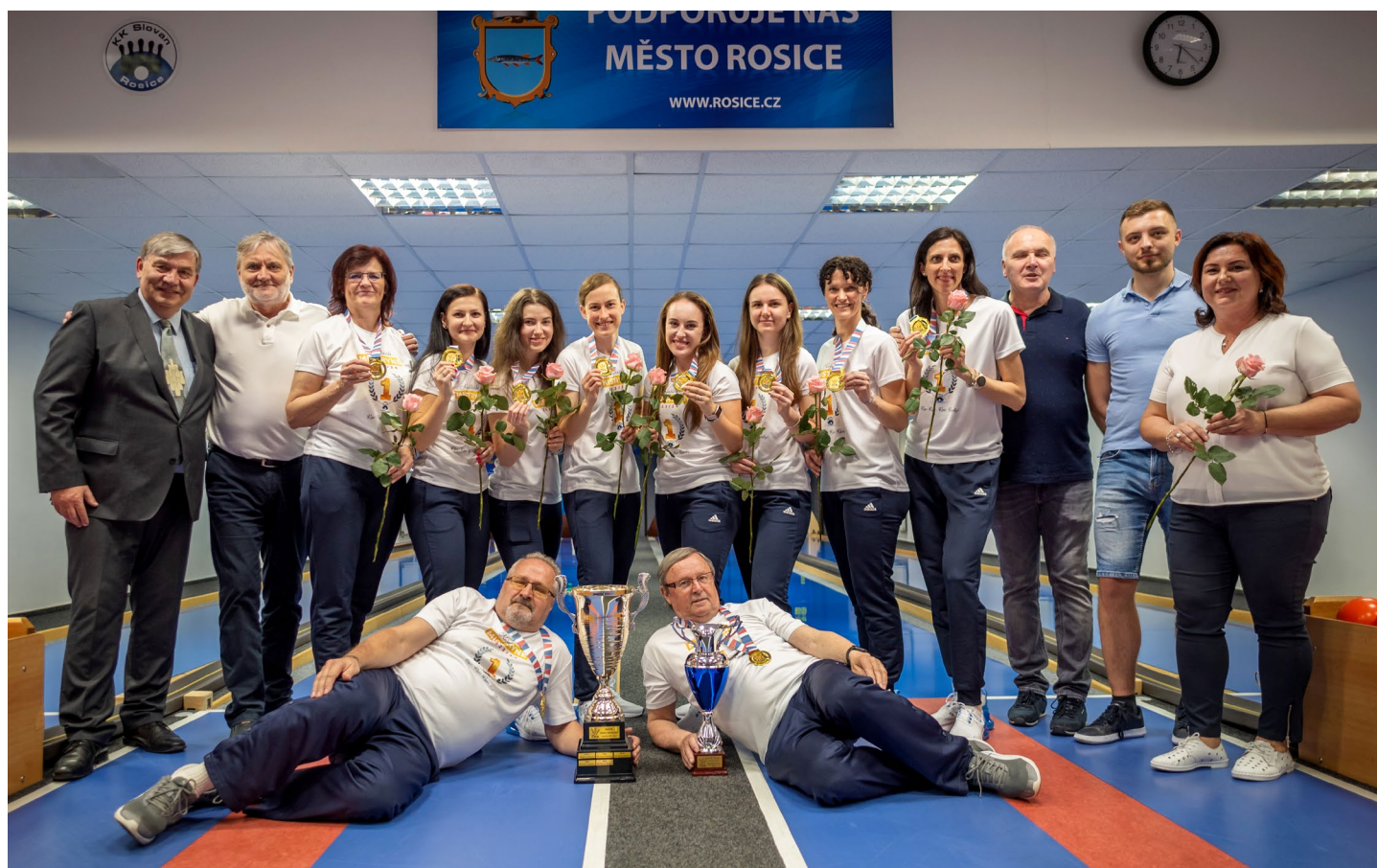
Šestý titul v řadě získaly ženy KK Slovan Rosice

Se soutěží se naopak loučí KK Vyškov, který zažil hrůzostrašný podzim, když uhrál jen remízu v Přerově. Na jaře Vyškov zapnul turbo, uhrál devět bodů, skončil v tabulce