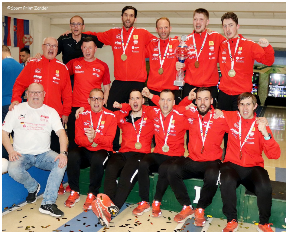
Tým Zerbstu slaví prvenství v Lize mistrů