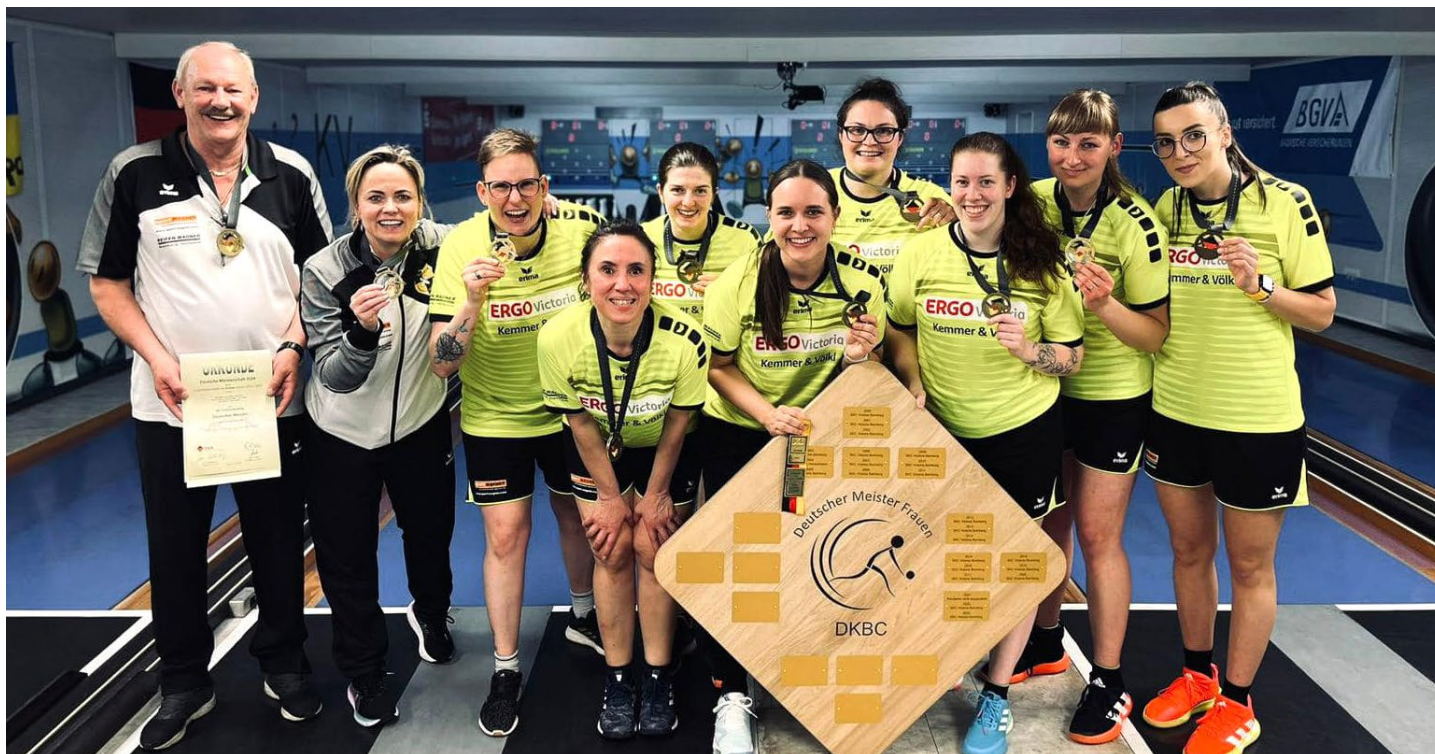
Až po napínavém závěru mohl Bamberg slavít další prvenství