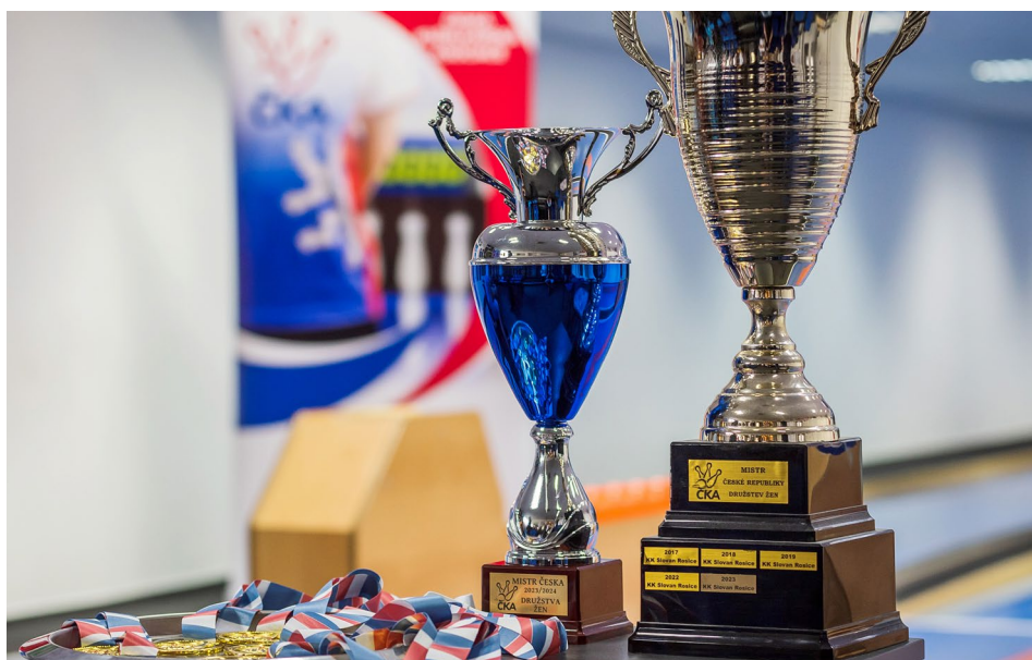
Pohár pro vítěze 1. KLZ má staronového držitele

Napínavý souboj naopak svedly týmy o třetí místo. Ještě před posledním kolem byla ve hře trojice družstev. Nováček Centropen Dačice s dvaceti body v zádech, ale soubojem v Rosicích před sebou.