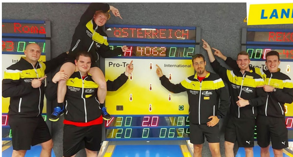
Nový rakouský rekord družstva mužů na 6×120 hs má hodnotu 4062 kuželek

Ale zpět k Superlize. Druhé místo v tabulce patří holkám z BBSV, které prohrály jen jediné utkání, a to právě s lídrem celé