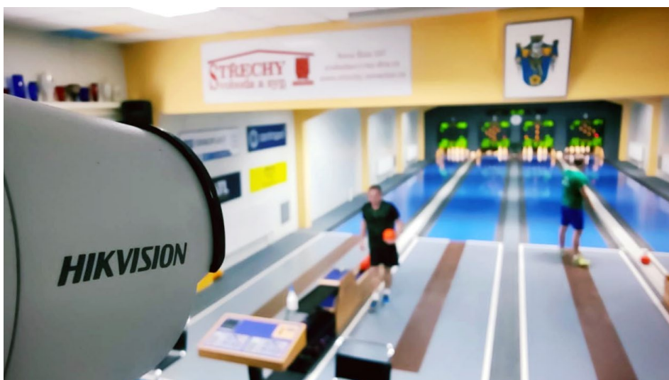
Kuželna TJ Centropen Dačice a kamera pro online přenosy